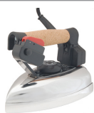
Plancha Due Effe Jolly de 800W