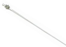
Sonda control de nivel