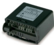
Control de nivel