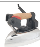
Segunda plancha de mano