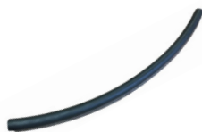
Tubo agua a bomba