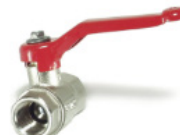
Grifo de purga