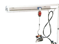
Troleo con luz Troleo con luz y suspensor