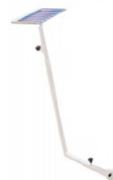
Descansador y doble pedalera