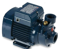
Bomba de carga de la caldera