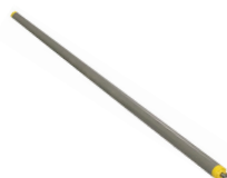
Rodillo conductor plástico