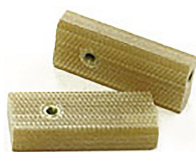
Tensor resistencia (2 uds.)