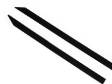
Gomas soldadura (2 uds.)