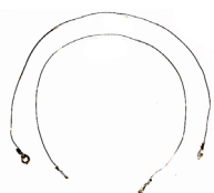
Resistencias (2 uds.)