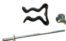
Clip sujeción teflón