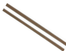
Aislante resistencia (2 uds.)